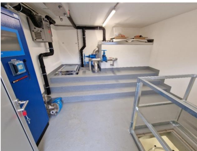
Erdgeschoss Reservoir – Stand jetzt